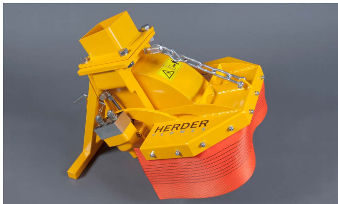
SCE-410H in basisuitvoering voor max. oliestroom van 40 l/min

De SCE-410H is de kleine stobbenfrees uit deze serie. Deze uitvoering is geschikt voor de meeste kranen tussen de 3 en 8 ton. De SCE-410H is uitgevoerd met een freeswiel met een diameter van 41cm (50cm met beitels). U heeft de keuze uit twee hydraulische motoren. Zo kunt u kiezen uit een motor voor een oliestroom tussen de 30 en 40 L/min (max 350 Bar) of tussen de 40 en 50 L/min (max 350 Bar).