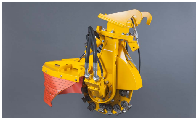
SCE-550H met Herder snelwissel voor 130 l/min