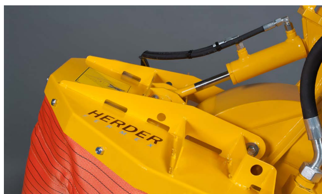
Hydraulisch verstelbare spanenkap bij de SCE-550H (en de SCE-800H)