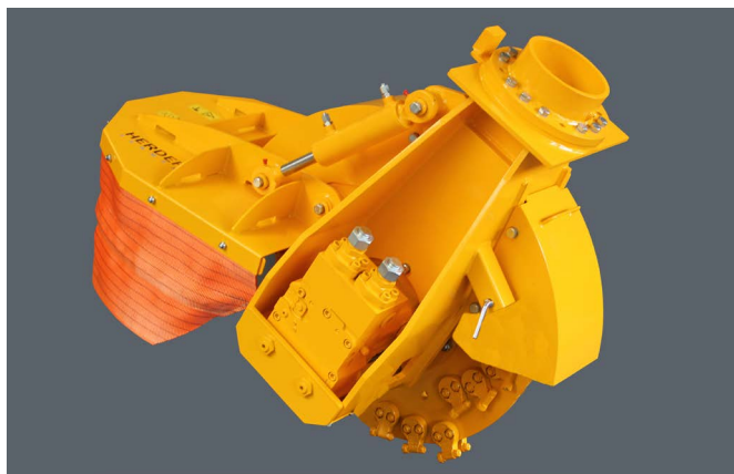
SCE-800H in basisuitvoering voor een oliestroom tussen de 80- en 160 l/min

De SCE-800H is de grootste stobbenfrees uit deze serie. De SCE-800H is uitgerust met een freeswiel met een diameter van 80cm (89 cm met beitels). Deze Herder-Fermex wordt standaard geleverd met een mechanisch verstelbare hydraulische motor. Daarmee is deze stobbenfrees geschikt voor elke hydraulische kraan met een oliestroom tussen de 80 en 160 L/min (max. 420 Bar) en te gebruiken voor de meeste kranen tussen de 10 en 20 ton.