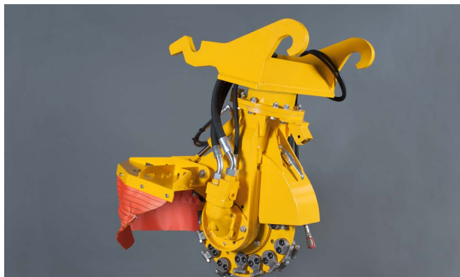
SCE-550H met verachttert snelwissel CW 20-40 voor 80 l/min

De SCE-550H is de middelste stobbenfrees uit deze serie. Deze uitvoering is geschikt voor de meeste kranen tussen de 7 en 14 ton. De SCE-550H is uitgevoerd met een freeswiel met een diameter van 55cm (64 cm met beitels). U heeft de keuze uit twee hydraulische motoren. Zo kunt u kiezen uit een motor voor een oliestroom tussen de 60 en 80 L/min (max 350 Bar) of tussen de 90 en 120 L/min (max 350 Bar).