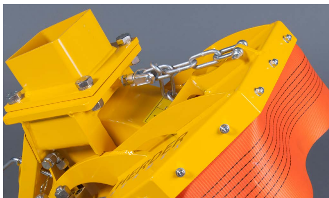
Mechanische verstelbare spanenkap bij de SCE-410H

De SCE-410H is standaard uitgevoerd met een mechanisch verstelbare spanenkap. Optioneel kan de SCE-410H uitgevoerd worden met een hydraulisch verstelbare spanenkap, de SCE-550H en de SCE-800H daarentegen zijn standaard uitgevoerd met een hydraulisch verstelbare spanenkap. Hierdoor kunt u - als gebruiker - vanuit de cabine van uw hydraulische graafmachine de spanenkap zo positioneren dat altijd maximale veiligheid en afscherming gegarandeerd is.